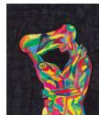
Roman Dym, 7. let, ZŠ Větrnáky