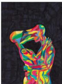
Roman Dym, 7. let, ZŠ Větrnáky