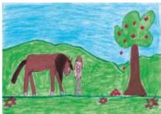
Mela Spudisová, 7. let, ZŠ Městoš, Praha 4