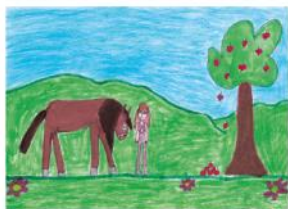
Mela Spudisová, 7. let, ZŠ Městoš, Praha 4